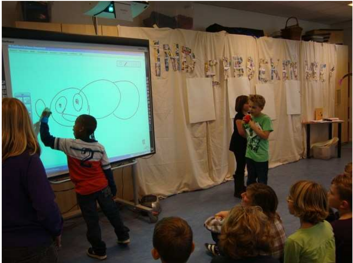
De kinderen, meester en juffen zongen het openingslied 'toe teken een verhaal voor mij'